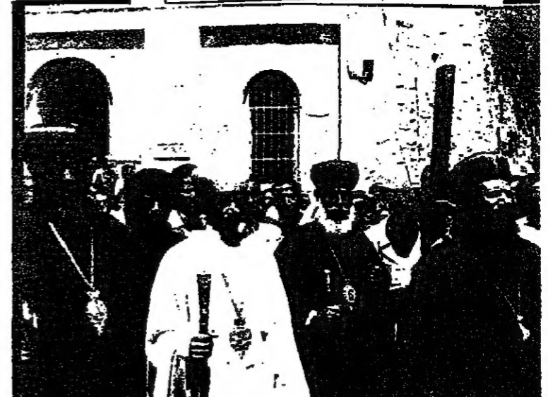
بطريك اثيوبيا تقلا هيئات خلال المسيرة الدينية في طريق الامم

القدس - تحتفل اليوم الطوائف المسيحية الغربية والشرقية بعيد الفصح المجيد - وستقام الصلوات والتعائير الدينية في البلدة القديمة وسيراس القناديس الاحتفالية بالطرقة والطرارة بحضور مئتين من وزارة الشؤون الدينية ومكتب مستشار رئيس الحكومة للشؤون العربية وبلدية القدس.